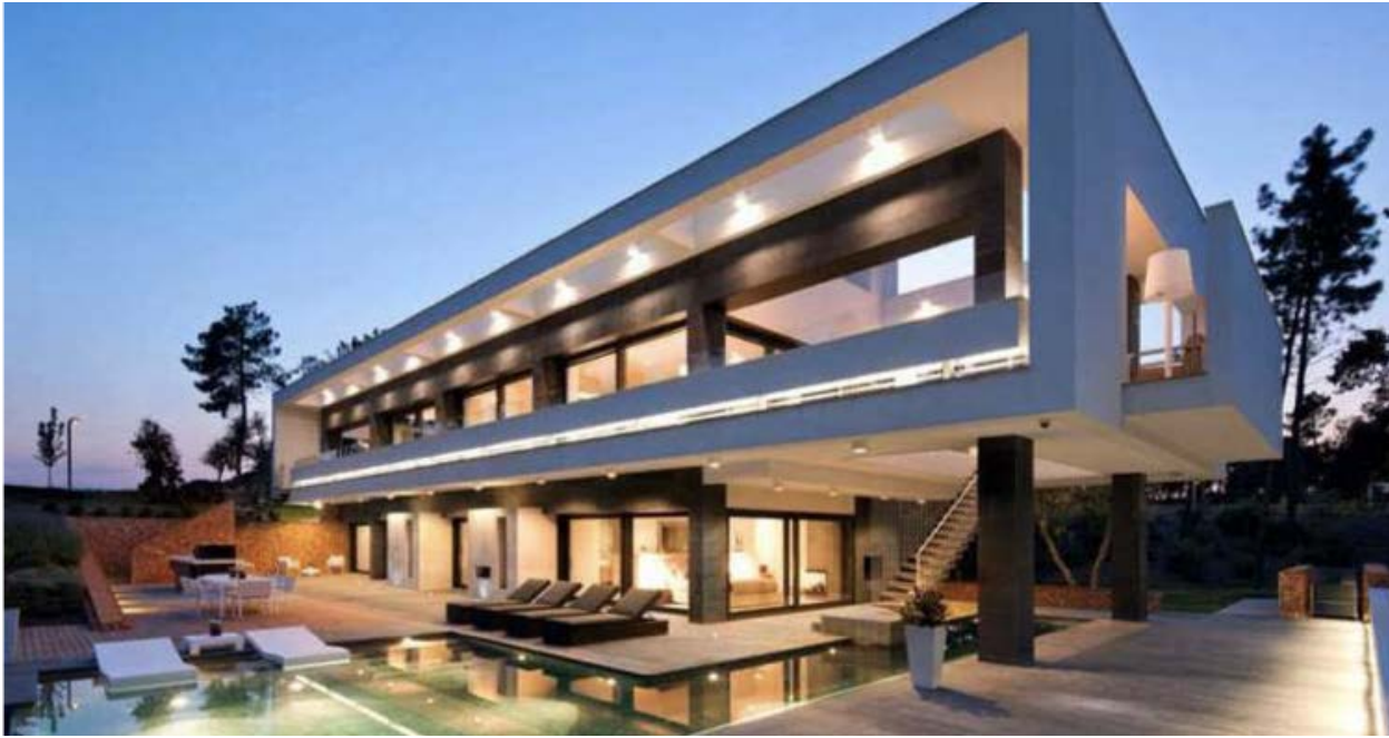
Top: PGA Catalunya Resort (Girona) / Bottom: Villa Magalean Hotel & Spa (Hondarribia)