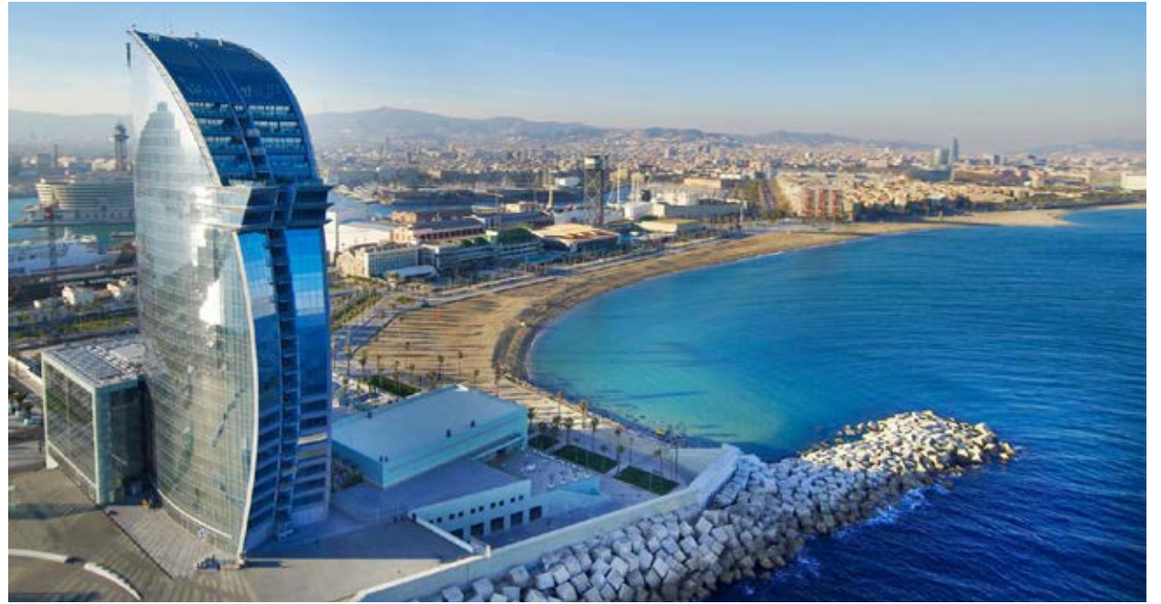
Top: Spa Hotel Vela (Barcelona) / Bottom: La Perla Centro Talaso-Sport (San Sebastián)